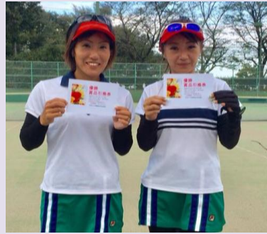
桑田宮崎 三芳TAフリー