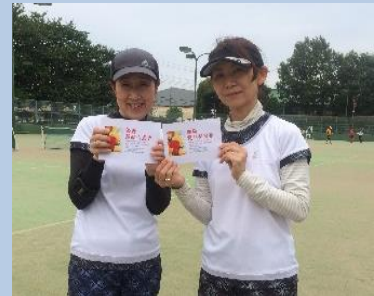
比良 フリー 長沢 フリー