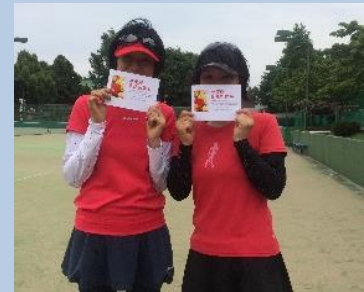
本郷 和光ゼロ 市村 和光ゼロ